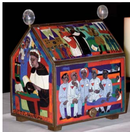
Der Schrein im Mittelpunkt der Feier