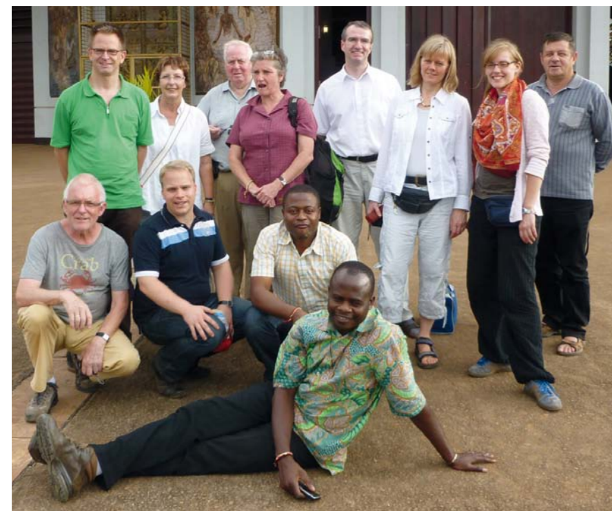
Die Reisegruppe vor der Basilika Mvolye in Yaoundé