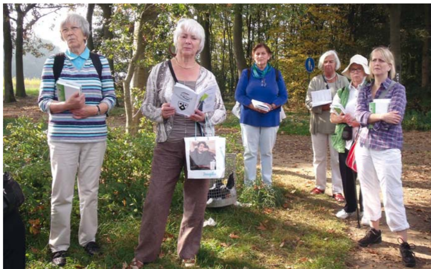
Von Duisburg nach Marienthal