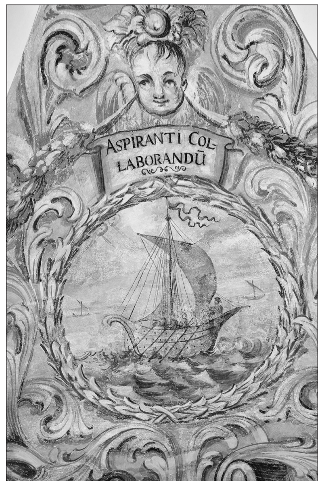
Emblematische Darstellung (Schiff bei wehendem Wind mit vollen Segeln) mit der Wirkung des Heiligen Geistes.

Gegenüber ist in der Stichkappe über der Eingangstür zur Bibliothek ein Emblem aufgetragen, das ein Thema aus dem menschlichen Alltagsleben zum Inhalt hat. Schiffe fahren mit vollen Segeln auf dem Meer. Warum aber geht dieses Segeln so gut und so flott voran? Die lateinische epigrammatische Aufschrift darüber: „Aspiranti collaborandum“ gibt die Erklärung für dieses Emblem. Nun zunächst einmal der Text in einer Behelfsübersetzung: „Mit dem, der einem zuweht, muss man zusammenarbeiten.“ Der Schiffmann, der Segler also muss sich auf den wehenden