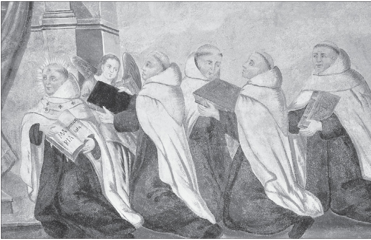
Karmelitenmönche in ihren weißen Mänteln bringen der kirchlichen Autorität ihre wissenschaftlichen Werke zur marianischen Theologie.

Die Fresken und Malereien wären wohl für Kloster und Straubinger Kunstgeschichte vergessen geblieben, lebte da in dem ehrwürdigen Konvent der Karmeliten nicht auch ein Pater, der aufs Engste mit der langen Geschichte des Hauses vertraut ist, der immer wieder hier und dort Spurensuche in die Vergangen-