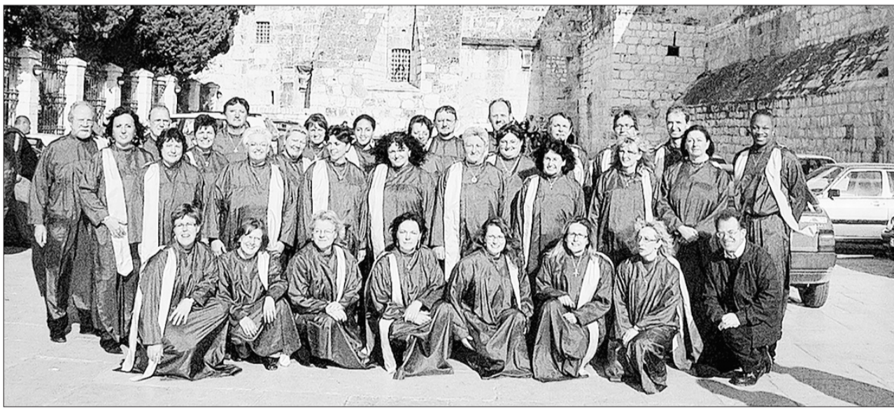
„Wer Herzen bewegt – bewegt die Welt“: Die „Gospelsterne“ treten am 23. November in der Karmelitenkirche auf.

Kinderschutzbund e.V. Straubing: Heute, Dienstag, 9 bis 12 Uhr, und donnerstags von 18 bis 20 Uhr sowie zusätzlich am Samstag, 8.11., 10 bis 14 Uhr.