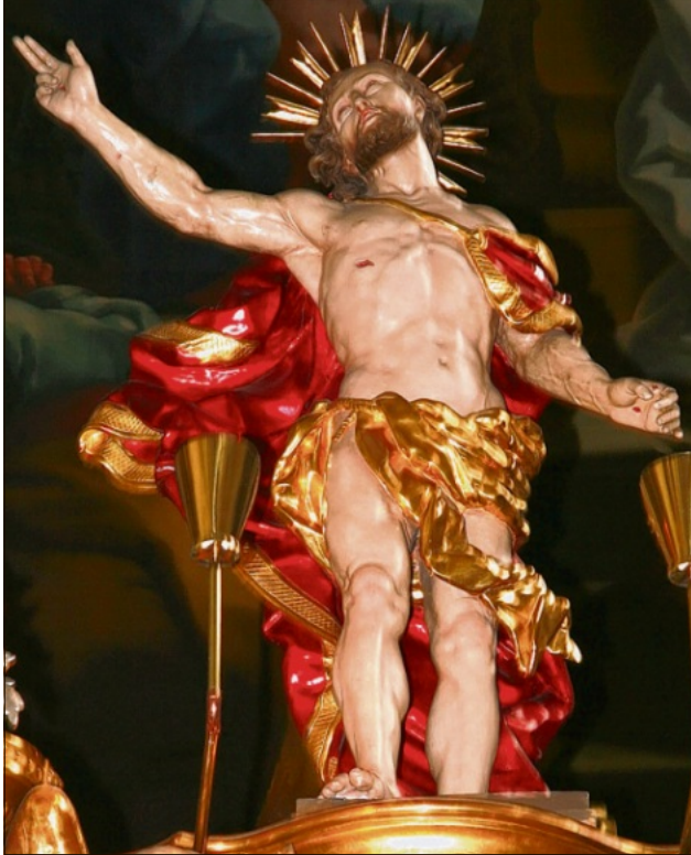
Der Auferstandene aus der Karmelitenkirche von Simon Hofer, kurz nach 1742.

Für die Bildhauer blieb die Ausfertigung der „Urständ“ eine hand-